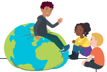
We hebben oor voor elkaar