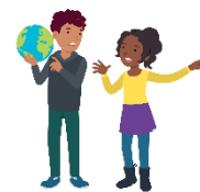
We lossen conflicten zelf op